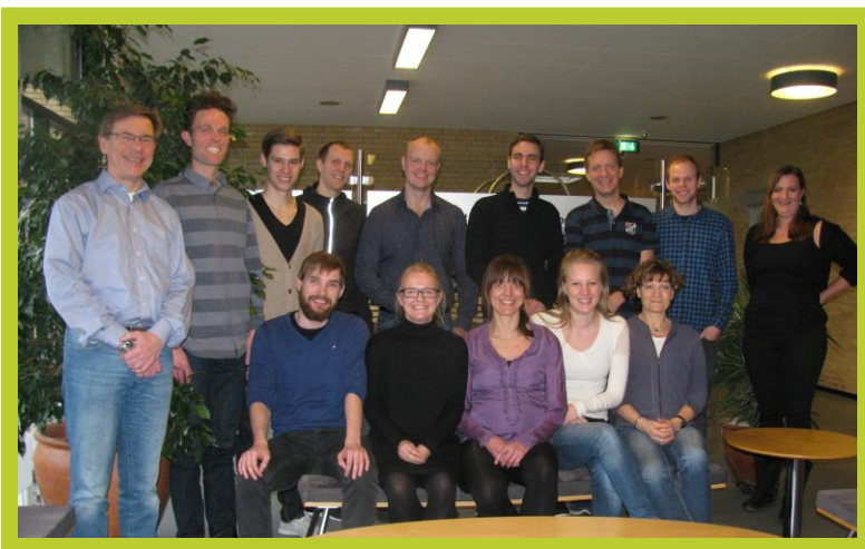
Billede af RUN-SAFE gruppen fra Januar 2014.

Vores kernekompetence er, at vi er i stand til at gennemføre large-scale prospektive kohorte studier og interventionsforsøg på 100.000 løbere. Dette er muligt fordi vi benytter sofistikerede web-baserede løsninger til indsamling af spørgeskemadata samt data fra GPS-ure og smartphones. Desuden har vi specialkompetencer inden for time-to-event analyse og repeated measurements analyse således at vi kan analysere vores data på højt videnskabeligt niveau og på en nuanceret måde. Tilmed er vi en tværfaglig gruppe af læger, fysioterapeuter, idrætsfolk, jordemødre, biomekanikere, biostatistikere, epidemiologer og IT-udviklere. Dette sikrer, at vi altid har den fornødne ekspertise til rådighed.